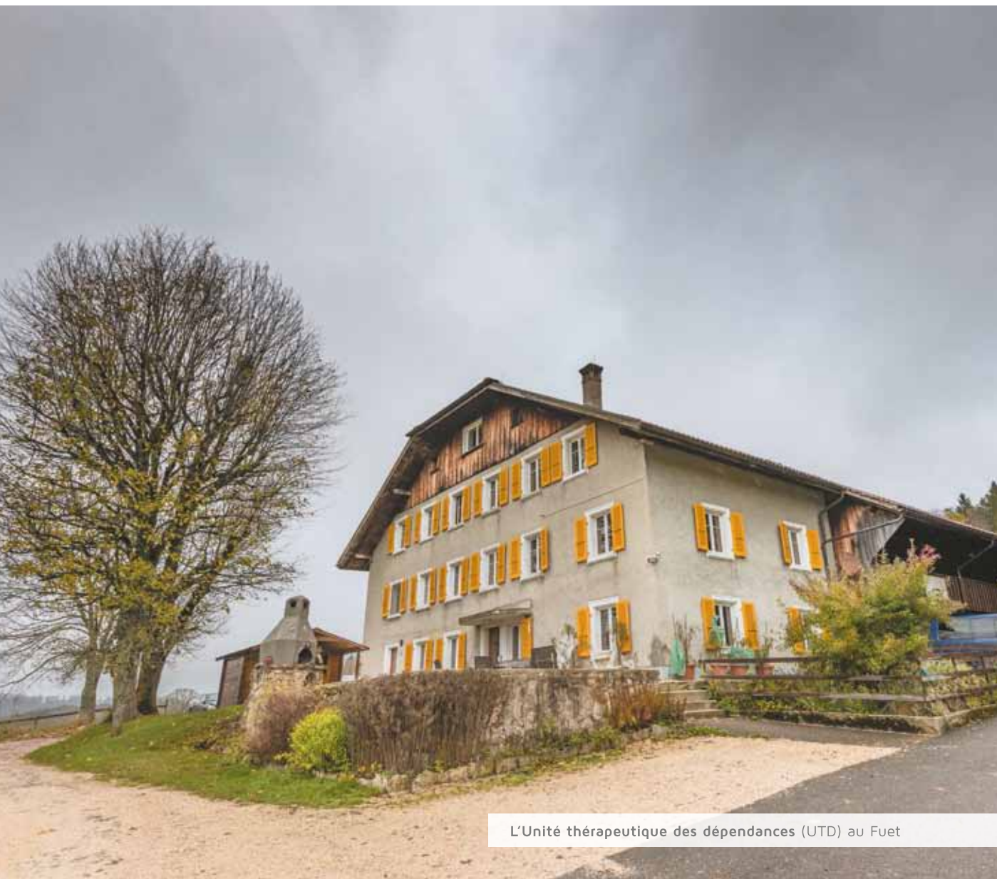
L'Unité thérapeutique des dépendances (UTD) au Fuet

Si par le passé, le site des Vacheries était davantage connu pour la prise en charge des personnes dépendantes aux drogues illégales, il accueille aujourd'hui tous les patients souffrant d'une addiction à une substance quelle qu'elle soit. La majorité de la patientèle, soit près de 55% des cas, s'y rend pour entreprendre un sevrage en raison d'une consommation trop importante d'alcool. Parmi les substances responsables de la dépendance, on retrouve